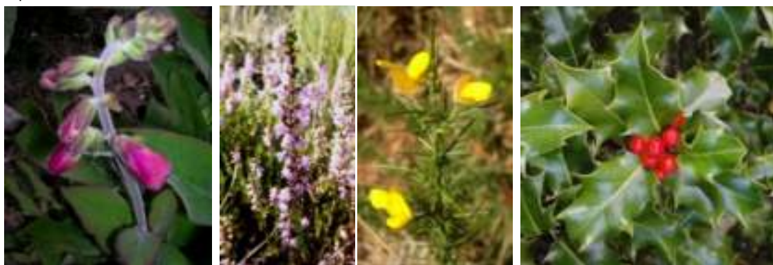
Quelques exemples d'espèces indicatrices de sols acides – de gauche à droite : Digitale pourpre ( Digitalis purpurea ), Callune ( Calluna vulgaris ), Ajonc d'Europe ( Ulex europaeus ), Houx ( Ilex aquifolium )

La liste des espèces caractéristiques de sols acides peut être obtenue en filtrant dans la base de données Couverts végétaux & Pollinisateurs sur une des valeurs indicatrices d'Ellenberg 1 : la réaction du sol. Les espèces cotées 1 (1 : hyperacidophiles) à 4 (4 : acidoclines (pH<5,5)) peuvent être retenues comme des espèces indicatrices de sols acides.