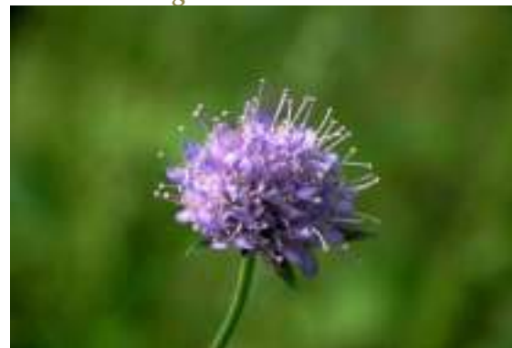
Succise des prés ( Succisa pratensis ) Licence : CC-BY-SA 2.0 FR (Jacques MARECHAL/ Tela Botanica)