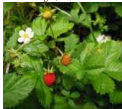
Fraisier sauvage ( Fragaria vesca )

Licence : CC-BY-SA 2.0 FR (Mathieu MENAND/ Tela Botanica)