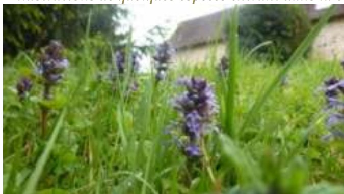
Bugle rampant ( Ajuga reptans )

Licence : CC-BY-SA 2.0 FR (Michel SOURIOUX / Tela Botanica)