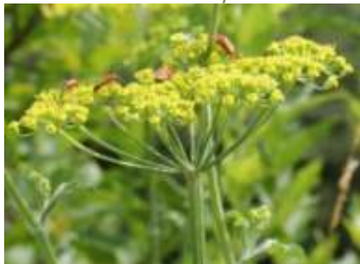
Panais cultivé ( Pastinaca sativa )