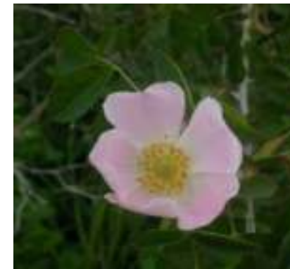
Rosier des chiens ( Rosa canina )