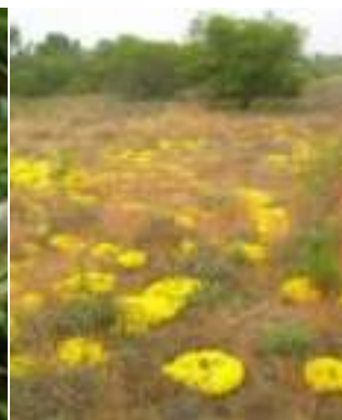
Orpin âcre ( Sedum acre )