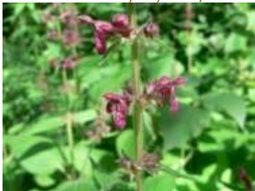
Epière des bois ( Stachys sylvatica )

Licence : CC-BY-SA 2.0 FR (Mathieu MENAND / Tela Botanica)