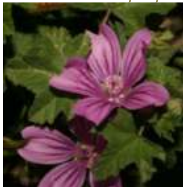
Mauve sylvestre ( Malva sylvestris )