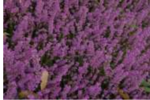
Bruyère cendrée ( Erica cinerea )