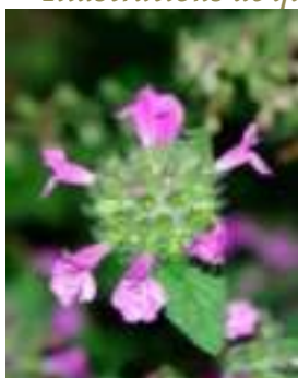
Calament ( Clinopodium vulgare )