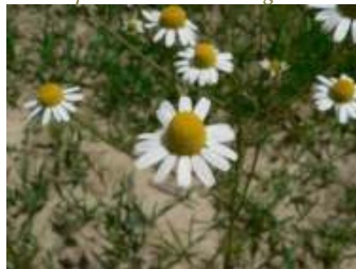
Matricaire chamomille ( Matricaria chamomilla )

Licence : CC-BY-SA 2.0 FR (Hugues TINGUY / Tela Botanica)