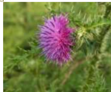
Cirse des marais ( Cirsium palustre )

Licence : CC-BY-SA 2.0 FR (Pierre CONSTANT / Tela Botanica)