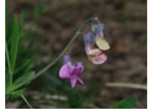
Gesse à feuilles de lin ( Lathyrus linifolius )