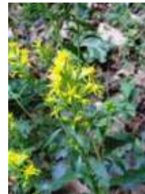
Solidage Verge d'Or ( Solidago virgaurea subsp. virgaurea )