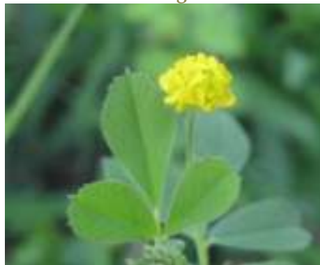
Luzerne lupuline ( Medicago lupulina )