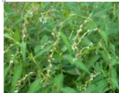
Renouée Poivre d'eau ( Persicaria hydropiper )