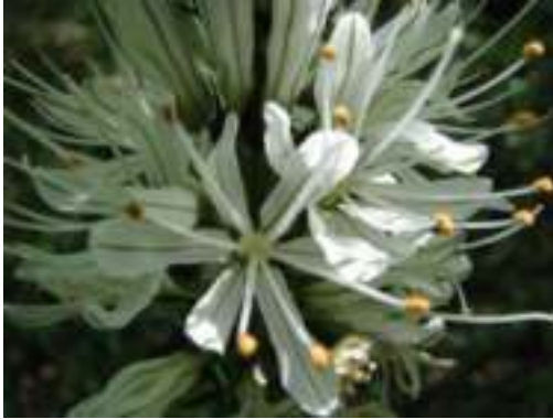
Asphodèle blanche ( Asphodelus albus )

Licence : CC-BY-SA 2.0 FR (Catherine MAHYEUX /Tela Botanica)