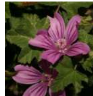
Mauve sylvestre ( Malva sylvestris )