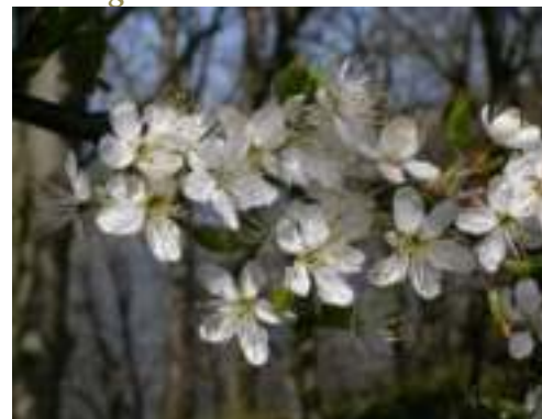
Prunelier ( Prunus spinosa )

Licence : CC-BY-SA 2.0 FR (Pierre BONNET / Tela Botanica)