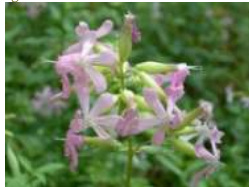
Saponaire officinale ( Saponaria officinalis )

Licence : CC-BY-SA 2.0 FR (Marie PORTAS / Tela Botanica)