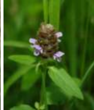
Brunelle commune ( Prunella vulgaris )

Licence : CC-BY-SA 2.0 FR (Mathieu MENAND / Tela Botanica)