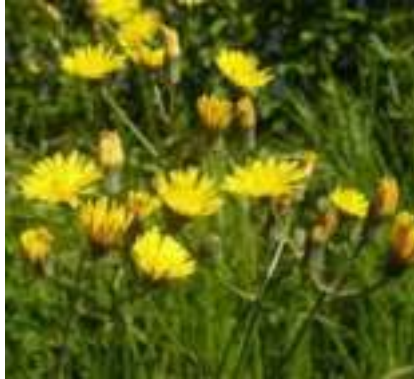
Crépide à vésicules ( Crepis vesicaria )

Licence : CC-BY-SA 2.0 FR (Thierry RAVAYROL / Tela Botanica)