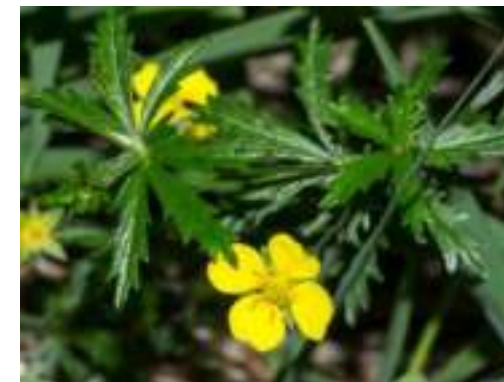
Potentille tormentille ( Potentilla erecta )