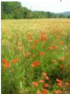
Coquelicot ( Papaver rhoeas )