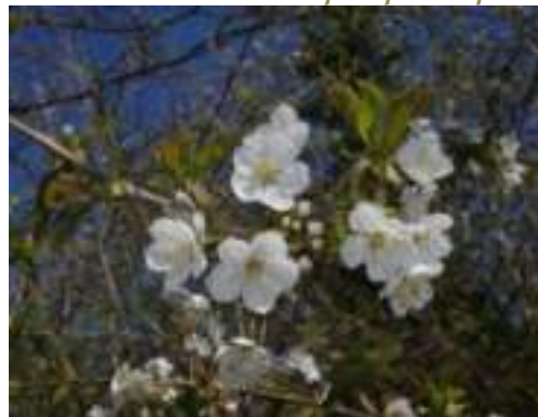
Merisier ( Prunus avium )