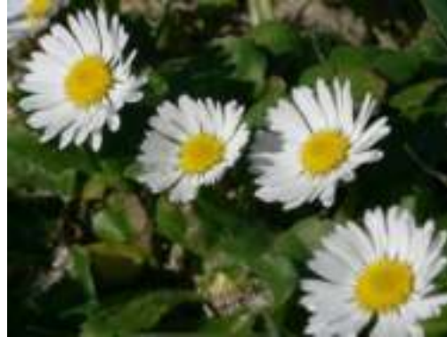
Pâquerette ( Bellis perennis )