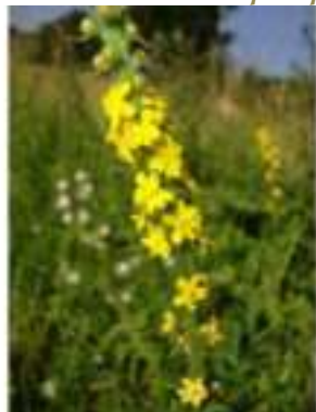
Aigremoine eupatoire ( Agrimonia eupatoria )