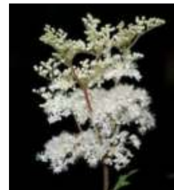
Reine des prés ( Filipendula ulmaria )

Licence : CC-BY-SA 2.0 FR (Bertrand BUI / Tela Botanica)