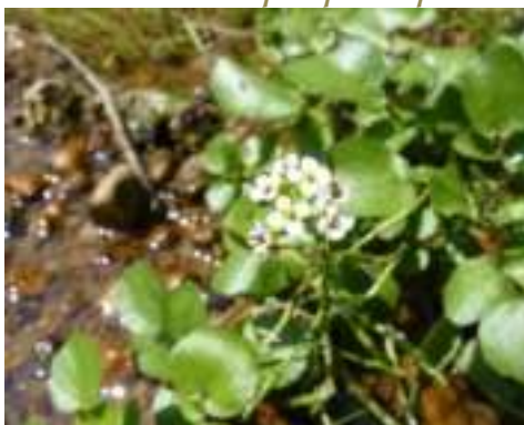
Cresson des fontaines ( Nasturtium officinale )

Licence : CC-BY-SA 2.0 FR (Mathieu MENAND / Tela Botanica)