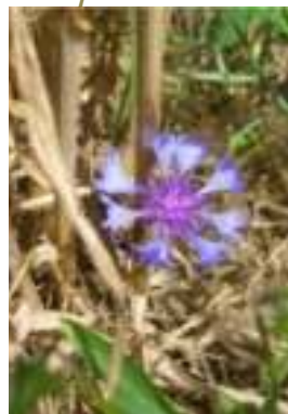
Bleuet ( Cyanus segetum )