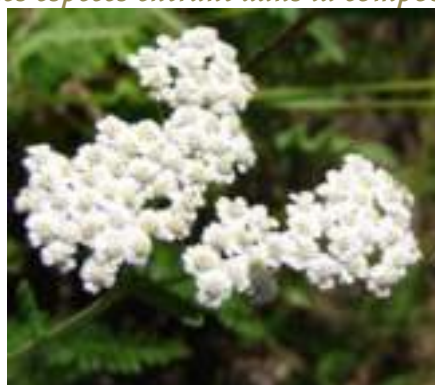
Achillée millefeuille ( Achillea millefolium )