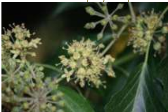
Lierre terrestre ( Hedera helix )

Licence : CC-BY-SA 2.0 FR (Hervé GOEAUX / Tela Botanica)