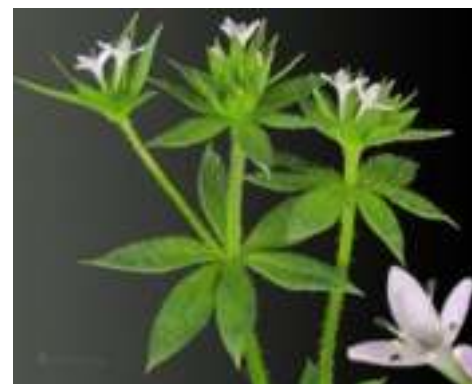
Shéardie des champs ( Sherardia arvensis )

Licence : CC-BY-SA 2.0 FR (Thierry SENECHAL-CHEVALLIER / Tela Botanica)