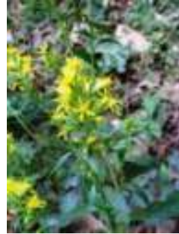
Solidage Verge d'Or ( Solidago virgaurea subsp. virgaurea )