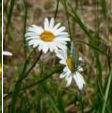
Marguerite ( Leucanthemum vulgare )

Licence : CC-BY-SA 2.0 FR (Thierry RAVAYROL / Tela Botanica)