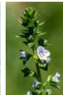
Véronique à feuilles de Serpolet ( Veronica serpyllifolia )

Licence : CC-BY-SA 2.0 FR (Jean-Jacques HOUDRE/ Tela Botanica)