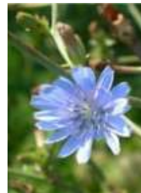
Chicorée amère ( Cichorium intybus )