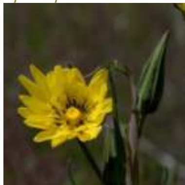
Salsifis des prés ( Tragopogon pratensis )

Licence : CC-BY-SA 2.0 FR (Jean-Pierre CAZES / Tela Botanica)