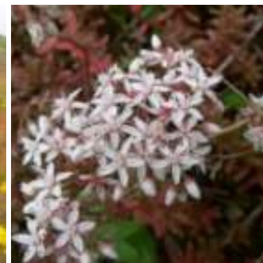
Orpin blanc ( Sedum album )