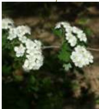
Aubépine à un style ( Crataegus monogyna )

Licence : CC-BY-SA 2.0 FR (Hervé GOEAUX / Tela Botanica)