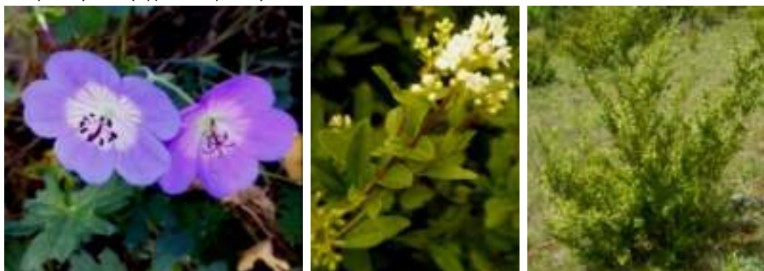
Quelques exemples d'espèces indicatrices de sols basiques – de gauche à droite : Géranium sanguin ( Geranium sanguineum ), Troène ( Ligustrum vulgare ), Buis en milieu naturel ( Buxus sempervirens )

A l'inverse, voici quelques exemples d'espèces caractéristiques de sols calcaires (pH > 7.5) : le Géranium sanguin ( Geranium sanguineum ), la Sauge des prés ( Salvia pratensis ), le Thé d'Europe le Nerprun purgatif ( Rhamnus cathartica ), le Buis ( Buxus sempervirens ) ou encore le Troène commun ( Ligustrum vulgare ). La liste des espèces caractéristiques de sols calcaires peut être obtenue en filtrant les valeurs 8 (espèces basophiles) et 9 (hyperbasophiles).