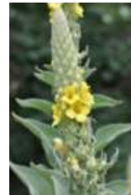
Bouillon blanc ( Verbascum thapsus )