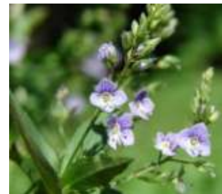
Véronique Mouron d'eau ( Veronica anagallis-aquatica ) - espèce complémentaire utilisable en dehors du Massif Central

Licence : CC-BY-SA 2.0 FR (Jacques MARECHAL / Tela Botanica)