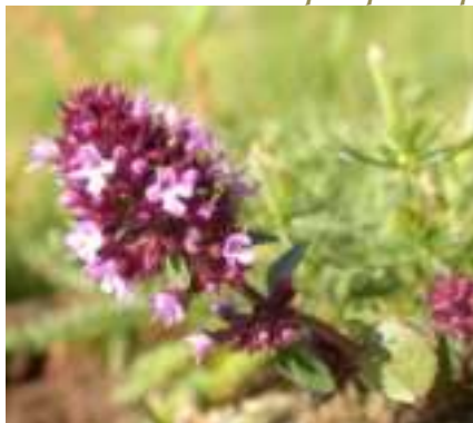
Thym faux pouliot ( Thymus pulegioides )