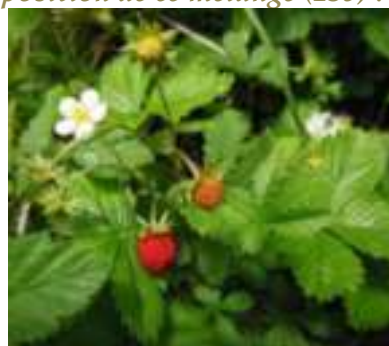
Fraisier sauvage ( Fragaria vesca ) Licence : CC-BY-SA 2.0 FR (Dominique REMAUD / Tela Botanica)