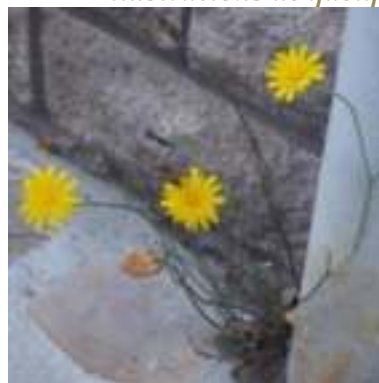
Crépide capillaire ( Crepis capillaris )

Licence : CC-BY-SA 2.0 FR (Isabelle PRZYBYLSK/ Tela Botanica)