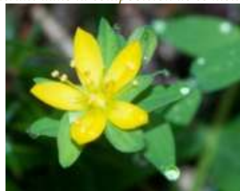
Millepertuis couché ( Hypericum humifusum )

Licence : CC-BY-SA 2.0 FR (Jean-Jacques HOUDRE/ Tela Botanica)