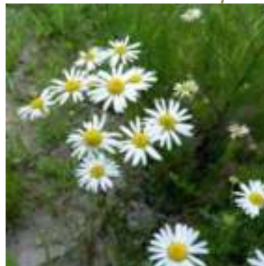
Matricaire inodore ( Tripleurospermum inodorum )

Licence : CC-BY-SA 2.0 FR (Julien BARATAUD / Tela Botanica)