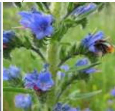
Vipérine commune ( Echium vulgare )

Licence : CC-BY-SA 2.0 FR (Isabelle PRZYBYLSK/ Tela Botanica)