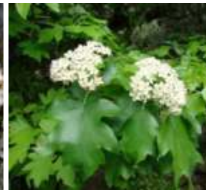
Alisier des bois ( Sorbus torminalis )