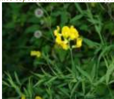
Gesse des prés ( Lathyrus pratensis )