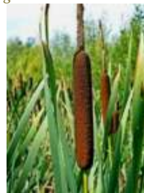
Massette à feuilles larges ( Typha latifolia )