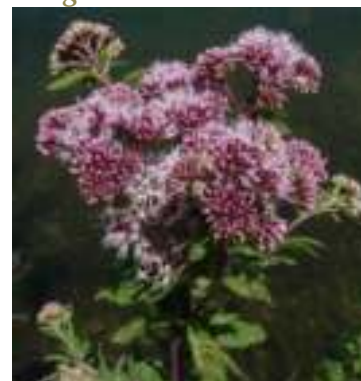
Eupatoire chanvrine ( Eupatorium cannabinum )