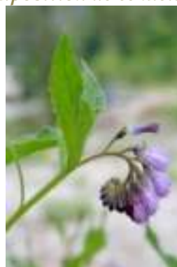
Grande Consoude ( Symphytum officinale )