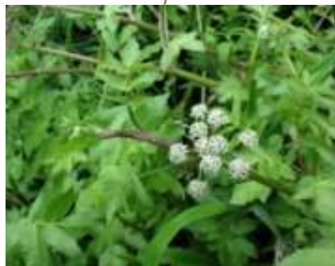
Ache nodiflore ( Helosciadium nodiflorum ) - espèce complémentaire en plaine (hors massif pyrénéen, plateaux limousins et Millevaches)