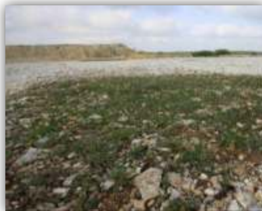
Revégétalisation spontanée dans une carrière du plateau d'Argentine après réaménagement (JCA/CBNSA, 2014) au 1 er plan