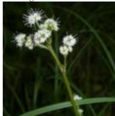
Sanicle d'Europe ( Sanicula europaea )

Licence : CC-BY-SA 2.0 FR (Mathieu MENAND / Tela Botanica)