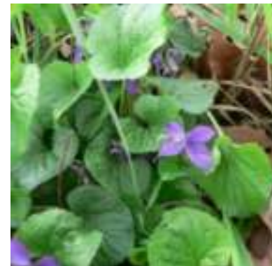
Violette odorante ( Viola odorata )