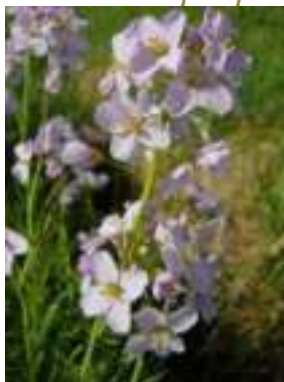
Cardamine des prés ( Cardamine pratensis ) Licence : CC-BY-SA 2.0 FR (Raymond HALLOT / Tela Botanica)