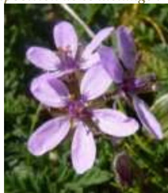
Erodium Bec-de-grue ( Erodium cicutarium )