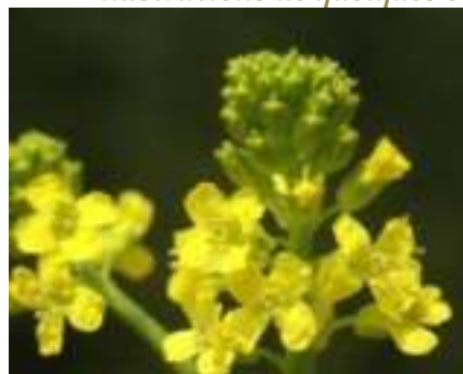
Barbarée commune ( Barbarea vulgaris )

Licence : CC-BY-SA 2.0 FR (Liliane ROUBAUDI / Tela Botanica)