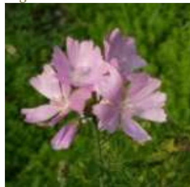
Mauve musquée ( Malva moschata )