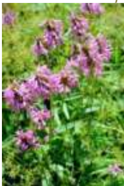
Bétoine officinale ( Betonica officinalis )

Licence : CC-BY-SA 2.0 FR (Jean-Pierre CAZES / Tela Botanica)