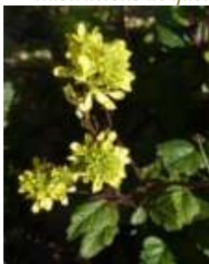
Moutarde des champs ( Sinapis arvensis )

Licence : CC-BY-SA 2.0 FR (Ans GORTER / Tela Botanica)