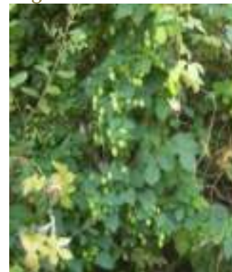
Houblon ( Humulus lupulus )