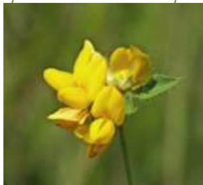
Lotier des marais ( Lotus pedunculatus )