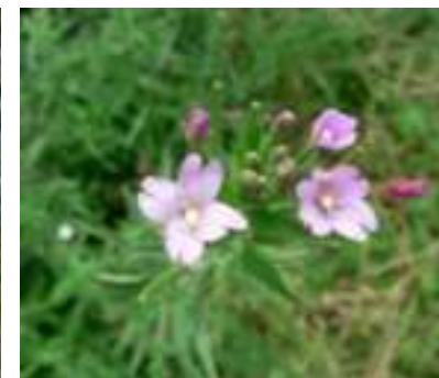
Epilobe à petites fleurs ( Epilobium parviflorum )

Licence : CC-BY-SA 2.0 FR (Mathieu MENAND / Tela Botanica)