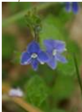
Véronique petit chêne ( Veronica chamaedrys )

Licence : CC-BY-SA 2.0 FR (Michel PANSIOT / Tela Botanica)