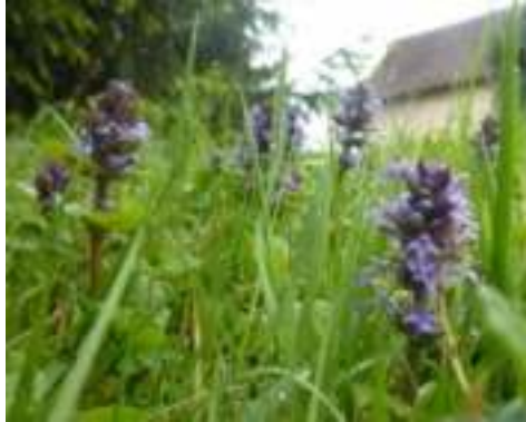
Bugle rampant ( Ajuga reptans )

Licence : CC-BY-SA 2.0 FR (Michel SOURIOUX / Tela Botanica)