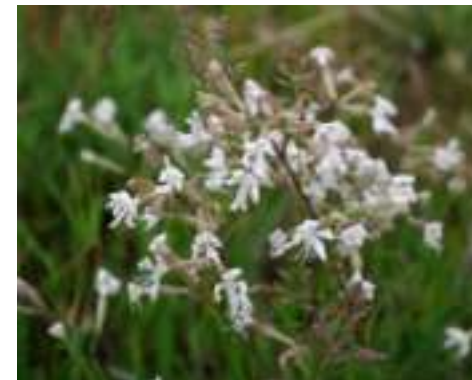
Silène penché ( Silene nutans )