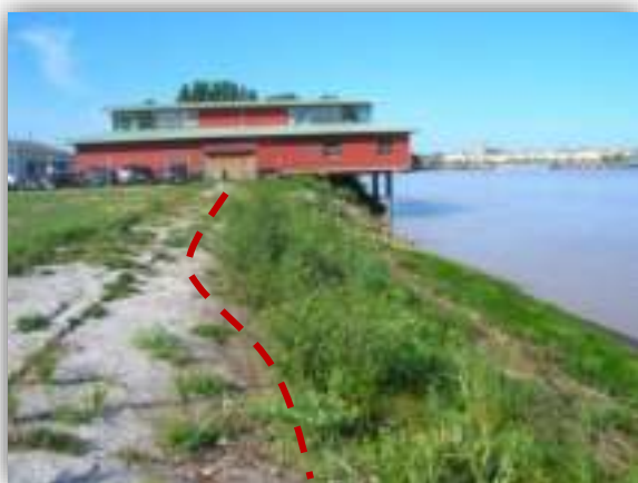
Revégétalisation artificielle en partie supérieure sur géotextile biodégradable (à gauche) et spontanée en partie inférieure sur géogrille anti-érosion (à droite), sur les digues en rive droite de Bordeaux (EC/CBNSA, août 2018). Moins de six mois après l'achèvement des travaux, on constate une très bonne reprise spontanée de la végétation sur la partie inférieure (non revégétalisée artificiellement), en particulier l'expression d'espèces caractéristiques des berges estuariennes.

La revégétalisation spontanée est à accompagner d'un suivi régulier au moins les premiers mois et premières années , afin d'évaluer son efficacité et surtout d'éliminer les éventuelles espèces exotiques envahissantes qui s'implanteraient. Une fois la renaturation du site constatée (en général au bout de quelques années seulement), les suivis peuvent être espacés.