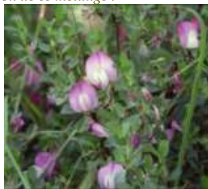
Bugrane épineuse ( Ononis spinosa )

Licence : CC-BY-SA 2.0 FR (Paul FABRE / Tela Botanica)