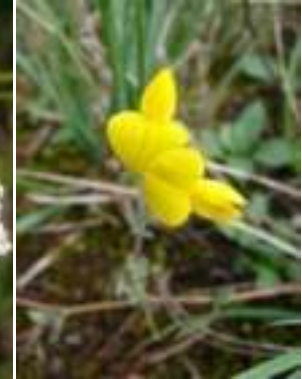
Lotier corniculé ( Lotus corniculatus )

Licence : CC-BY-SA 2.0 FR (Paul FABRE / Tela Botanica)