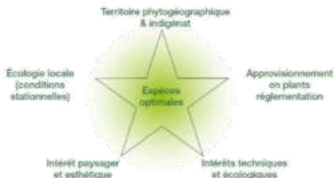
Figure 1 : Critères à prendre en compte en amont de la plantation d'espèces ligneuses (C. Cornier et al., 2011)

En amont d'un projet de revégétalisation à vocation écologique et/ou paysagère impliquant l'implantation de végétaux, il existe cinq grands critères qu'il convient de prendre en compte pour le choix des espèces végétales (d'après Cornier et al, 2011).