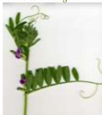
Vesce des moissons ( Vicia segetalis )

Licence : CC-BY-SA 2.0 FR (Mathieu MENAND / Tela Botanica)