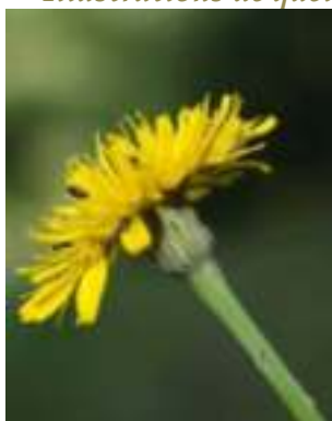
Porcelle enracinée ( Hypochaeris radicata )