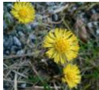
Pas-d'âne ( Tussilago farfara )