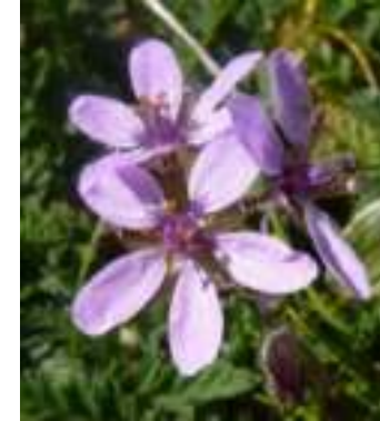
Erodium Bec-de-grue ( Erodium cicutarium )

Licence : CC-BY-SA 2.0 FR (Pierre BONNET/ Tela Botanica)