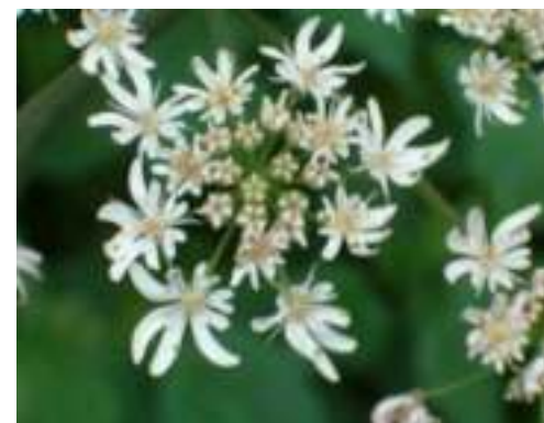
Berce commune ( Heracleum sphondylium )