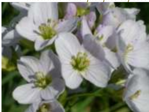
Cardamine des prés ( Cardamine pratensis )