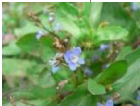
Cresson de cheval ( Veronica beccabunga )