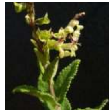
Sauge des bois ( Teucrium scorodonia )

Licence : CC-BY-SA 2.0 FR (Dominique REMAUD/ Tela Botanica)