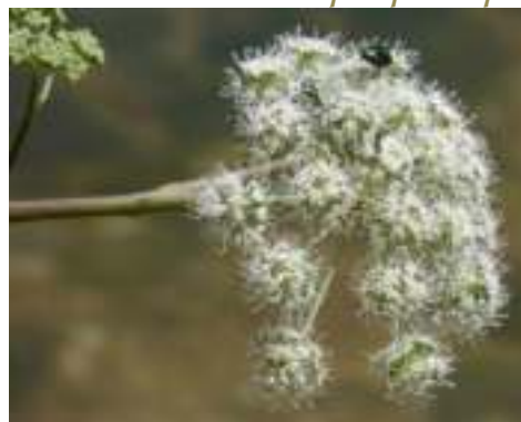
Angélique sylvestre ( Angelica sylvestris )

> > Illustrations de quelques espèces entrant dans la composition de ce mélange :