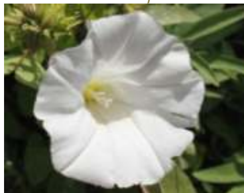
Liseron des haies ( Convolvulus sepium )