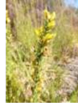
Ajonc nain ( Ulex minor )