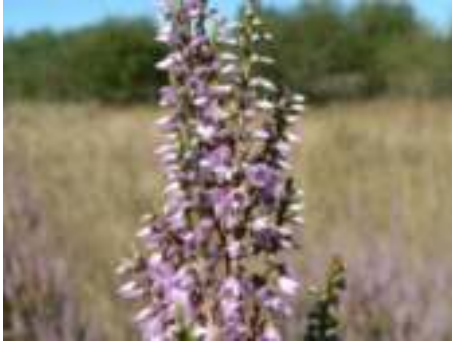
Callune ( Calluna vulgaris )