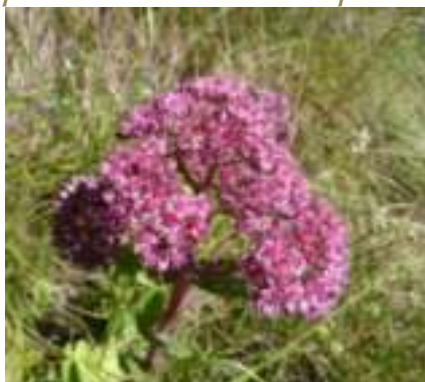
Orpin reprise ( Hylotelephium telephium )

Licence : CC-BY-SA 2.0 FR (Hugues TINGUY / Tela Botanica)