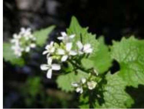
Alliaire ( Alliaria petiolata )