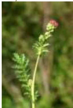
Petite Pimprenelle ( Poterium sanguisorba )