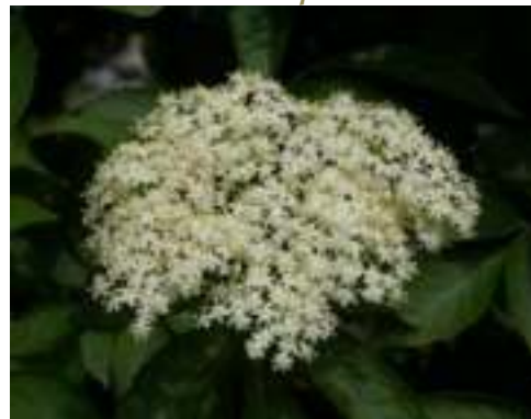
Sureau noir ( Sambucus nigra )