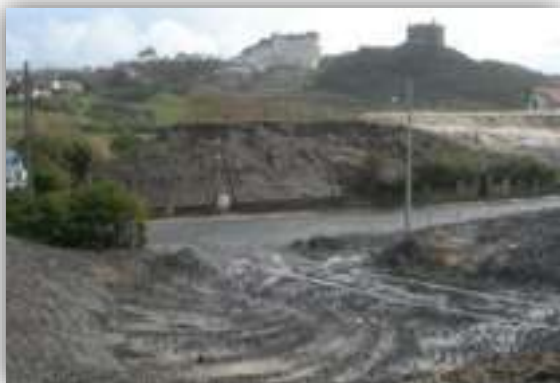
Risque d'érosion fort compte tenu des pentes et type de substrat (littoral basque, CBNSA).