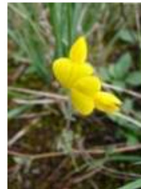
Lotier corniculé ( Lotus corniculatus )