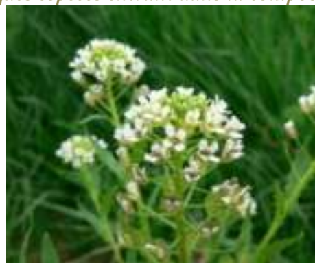
Tabouret des champs ( Thlaspi arvense )