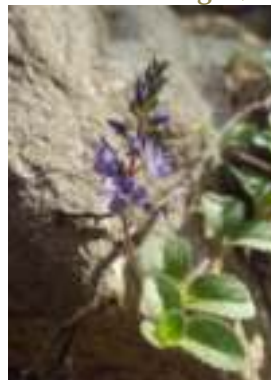
Véronique officinale ( Veronica officinalis )

Licence : CC-BY-SA 2.0 FR (Emmanuel STRATMAINS/ Tela Botanica)