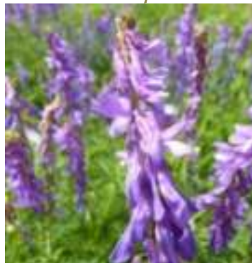
Vesce de Cracovie ( Vicia cracca )

Licence : CC-BY-SA 2.0 FR (Mathieu MENAND / Tela Botanica)