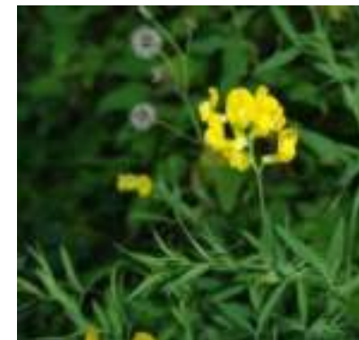
Gesse des prés ( Lathyrus pratensis )

Licence : CC-BY-SA 2.0 FR (Julien BARITAUD / Tela Botanica)