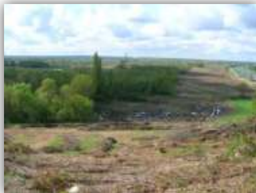
Risque de développement d'espèces exotiques envahissantes après ouverture du milieu, compte-tenu des végétations en présence antérieurement (bosquet mono-spécifique d'Ailanthès ; Cubzac-les-Ponts, CBNSA)

La revégétalisation spontanée est à accompagner d'un suivi régulier au moins les premiers mois et premières années , afin d'évaluer son efficacité et surtout d'éliminer les éventuelles espèces exotiques envahissantes qui s'implanteraient. Une fois la renaturation du site constatée (en général au bout de quelques années seulement), les suivis peuvent être espacés.