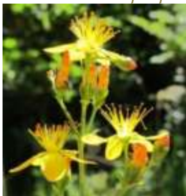
Millepertuis élégant ( Hypericum pulchrum )

Licence : CC-BY-SA 2.0 FR (Hugues TINGUY / Tela Botanica)