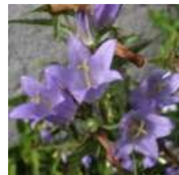
Campanule gantelée ( Campanula trachelium ) Licence : CC-BY-SA 2.0 FR (Liliane ROUBAUDI / Tela Botanica)