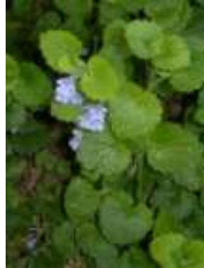
Lierre terrestre ( Glechoma hederacea )

Licence : CC-BY-SA 2.0 FR (Michel SOURIOUX / Tela Botanica)