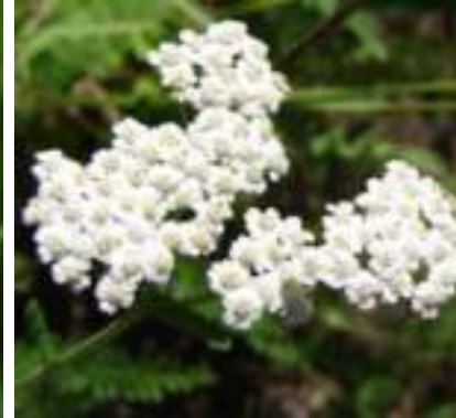
Achillée millefeuille ( Achillea millefolium )

Licence : CC-BY-SA 2.0 FR (Jean-Luc GORREMANS / Tela Botanica)