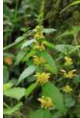
Lamier jaune ( Lamium galeobdolon )